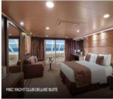
MSC YACHT CLUB DELUXE SUITE