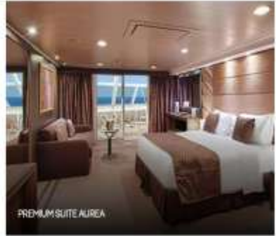
PREMIUM SUITE AIREA