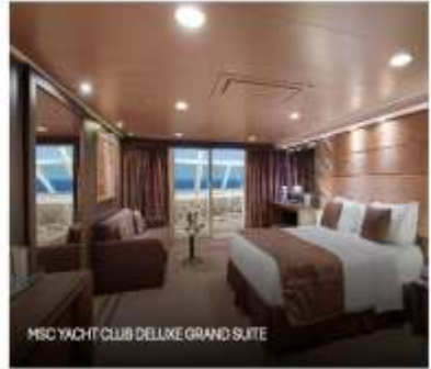
MSC YACHT CLUB DELUXE GRAND SUITE