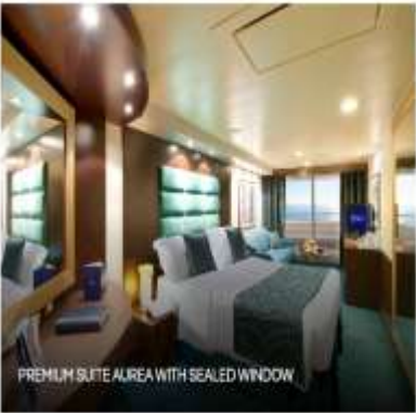
PREMIUM SUITE AIREA WITH SEALED WINDOW