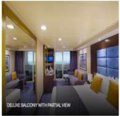
DELUXE BALCONY WITH PARTIAL VIEW