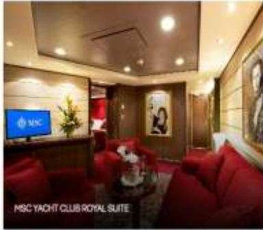
MSC YACHT CLUB ROYAL SUITE