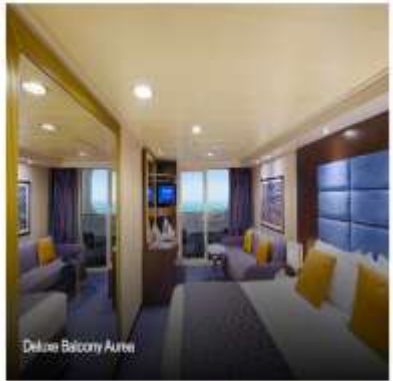
Deluxe Balcony Airea