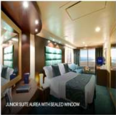
JUNIOR SUITE AIREA WITH SEALED WINDOW