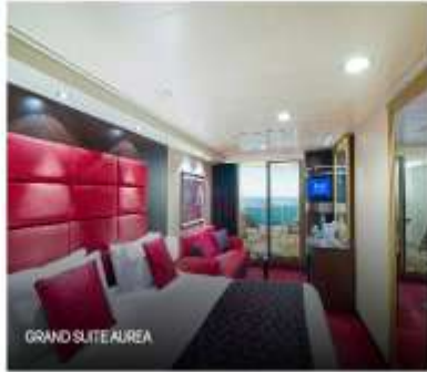
GRAND SUITE AIREA