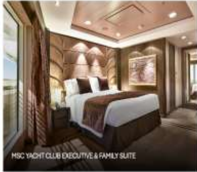
MSC YACHT CLUB EXECUTIVE & FAMILY SUITE