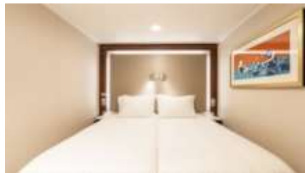
พัก 1-2 ท่าน

From 13 - 14 sq.m Max Occupancy 2-4 ^ Deck 5/8/9/10/11/12/13/15 2 Single Beds / 2 Single Beds + 1 Ceiling Pullman Bed / 1 Single Bed + 1 Pullman Bed + 1 Double Sofa Bed