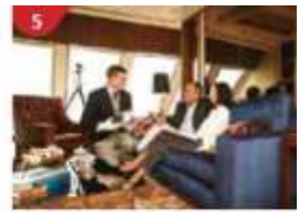
5 The Palace Indulge in European-style buffet service and exclusive facilities.