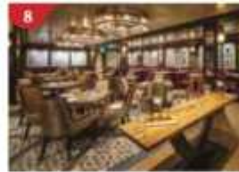
8 Bistro By Mark Best Relish contemporary Western cuisine from the internationally-acclaimed Australian chef.