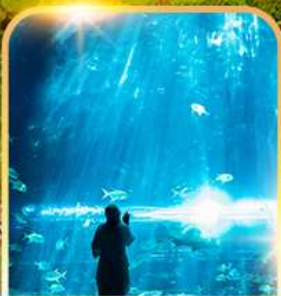
อควาเรียม