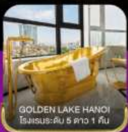
GOLDEN LAKE HANOI โรงแรมระดับ 5 ดาว 1 คืน