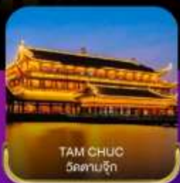
TAM CHUC วัดตามจิก