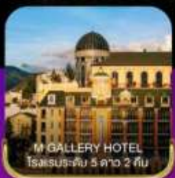
M GALLERY HOTEL โรงแรมระดับ 5 ดาว 2 คืน