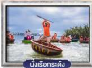
นั่งเรือกระดิง