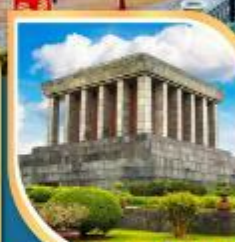
สุสานประธานโฮจิมินห์