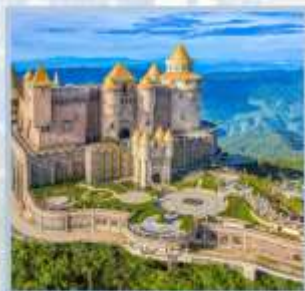
ปราสาทจันทร