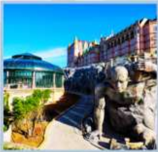
โซน Eclipse Square