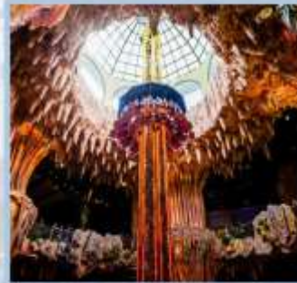
สวนสนุก Fantasy Park