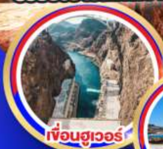
เฟือนฮูเวอร์