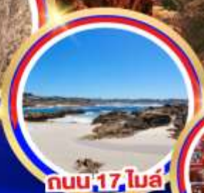
ถนน 17 ไมล์