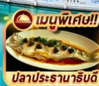
เมนูพิเศษ!! ปลาประรานาธิบดี