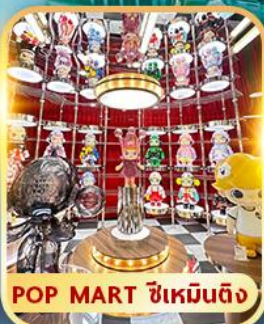
POP MART ซีเหมินติง