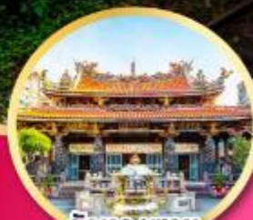
วัดหลงชาม