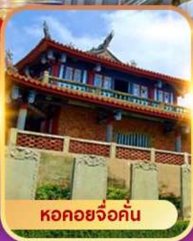
หอคอยจ้อคั่น