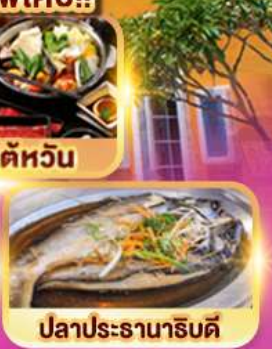
ปลาประซานาธิบดี