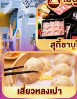
สุกชาบโต๋หวัน