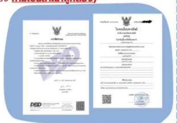
ตัวอย่างหนังสือจดทะเบียนบริษัทฯ และ ใบทะเบียนพาณิชย์