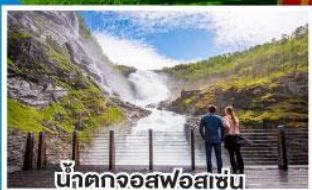
น้ำตกจอสฟอสเซ่น