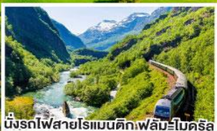
นั่งรถไฟสายโรแมนติกเฟลัมโบเดครี