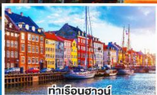
ท่าเรือชวานน์