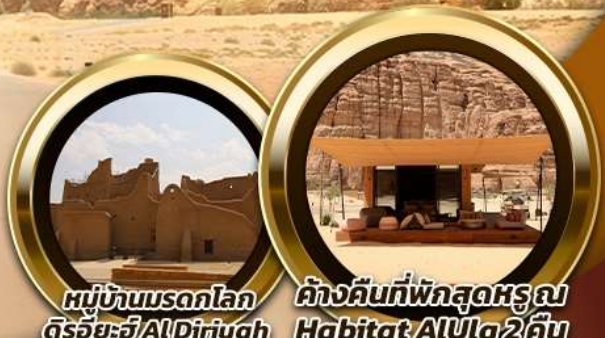
หมู่บ้านมรดกโลก ดิรัยยะฮ์ AlDiriyah | ค้างคืนที่พักสุดหรู ณ Habitat AlUla 2คืน

บินหรู อยู่สบาย เทียบชิด ซัด ซัด 10 ท่าน คอนเฟิร์มเดินทาง