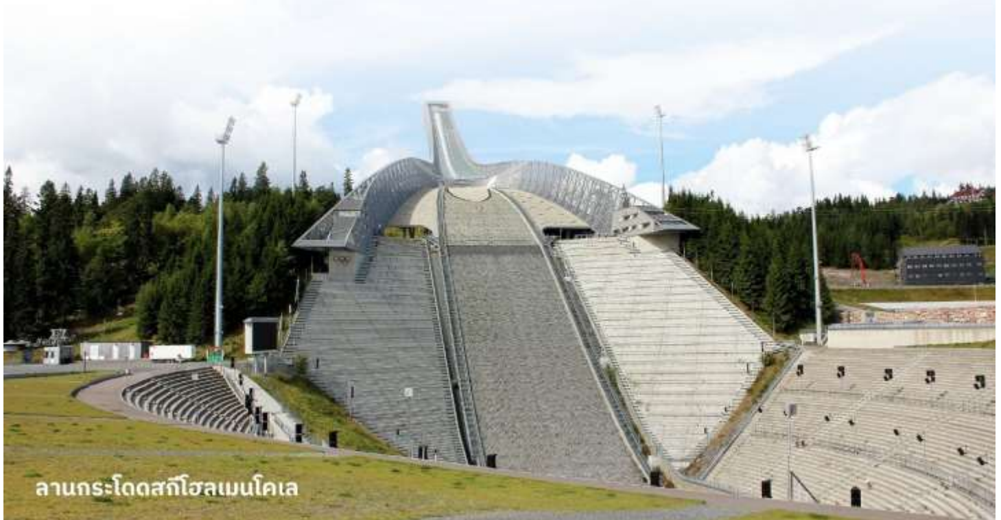
ลานกระโดดสกีโฮลเมนโคเลน

ตั้งอยู่ในเมืองออสโล ประเทศนอร์เวย์ เป็นหนึ่งในสถานที่ที่มีชื่อเสียงในวงการสกีกระโดด มีประวัติยาวนานและเป็นที่รู้จักอย่างกว้างขวางในการแข่งขันสกีกระโดดและการแข่งขันกีฬาฤดูหนาวอื่นๆ นอกจากนี้ยังมีพิพิธภัณฑ์เกี่ยวกับกีฬาและศูนย์ข้อมูลเกี่ยวกับประวัติศาสตร์ของการสกีกระโดดให้ผู้เยี่ยมชมได้ศึกษาด้วย