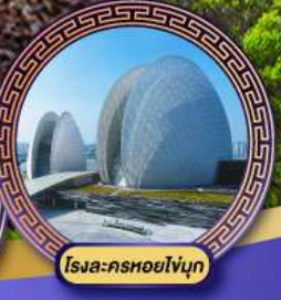
โรงแจ-ครฮอยไญญ