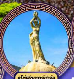
จูโทพีซเซอร์กิสรา