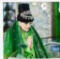
เทพกระซิบ