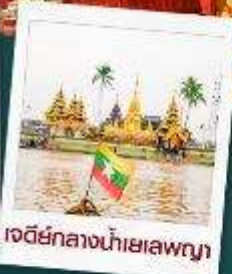
เจดีย์กลางน้ำเยเลพญา