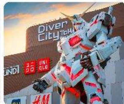
ย่านโอไดบะ ห้างไดเวอร์ซิตี ODAIBA SEASIDE PARK