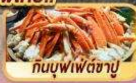
กินบุฟเฟ่ต์ซาปู