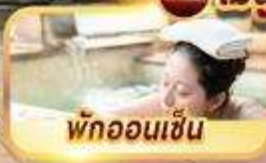
พักออนเซ็น