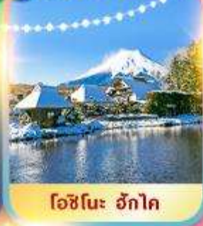
โชนินะ ฮักโค