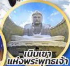
เป็นเขาแห่งพระพุทธรเจ้า

ชมความน่ารักของสัตว์ต่างๆ ที่พิพิธภัณฑ์สัตว์น้ำโอตารุ