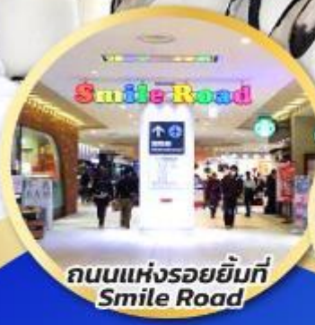
ถนนแห่งรอยยิ้มที่ Smile Road