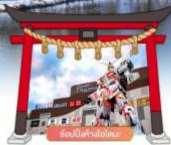
ฮอนบิงทางโอโตะ