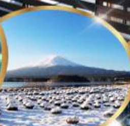
สวน ไออิชิ พาร์ค