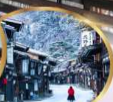
หมู่บ้านโบราณ นาราอิ จุกุ