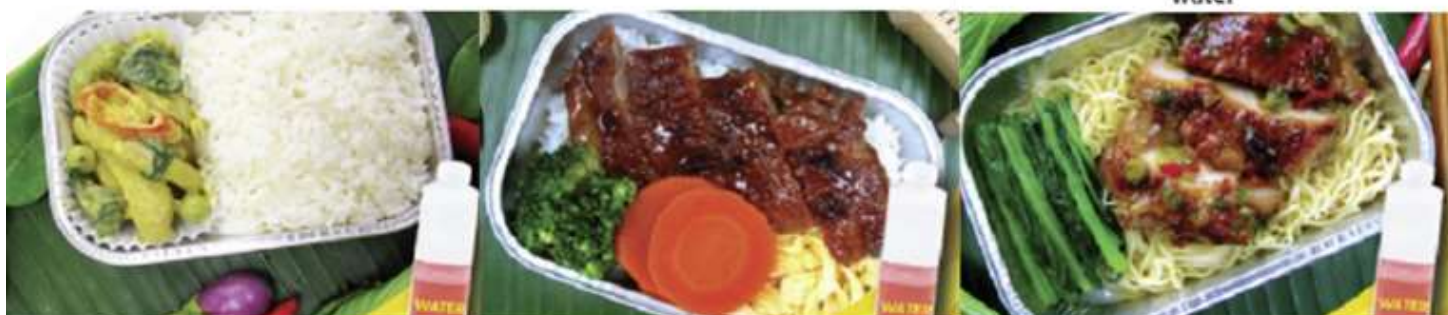
Chicken roasted with herb and noodle and water