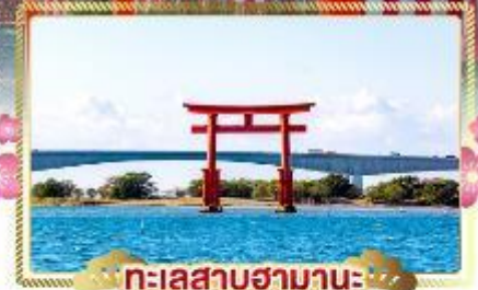
ทะเลสาบฮามานะ