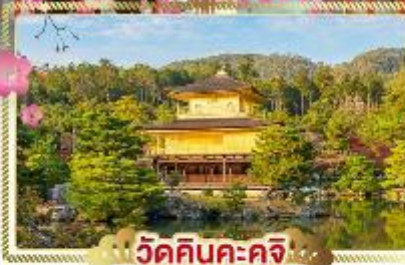
วัดคินคะคุจิ