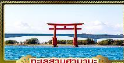
ทะเลสาบฮามานะ