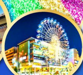
ช้อปปิ้งย่านซากาเอะ