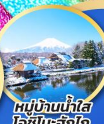
หมู่บ้านน้ำใส โอชิโนะอ๊กโก