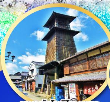
หอรบั้งโทคินะคาเนะ