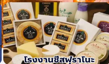
โรงงานชีสฟูรานะ