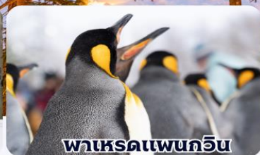
พาเหรดเพนกวิน