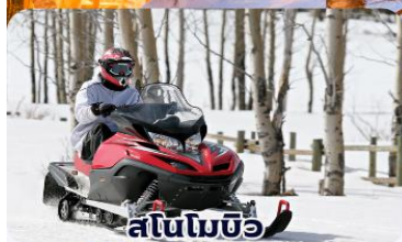
สโนว์โมบิล