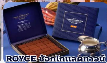
ROYCE ช็อกโกแลตทอว์น