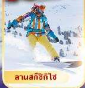
ลานสกีซิกิไซ