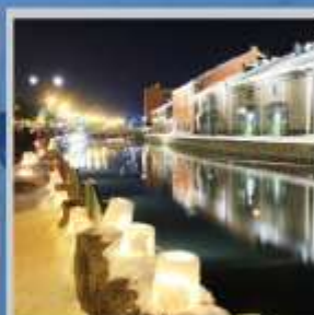
"OTARU CANAL FEST"