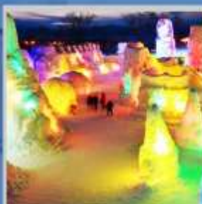
"SHIKOTSU ICE FEST"