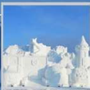
"ASAHIKAWA SNOW FEST"