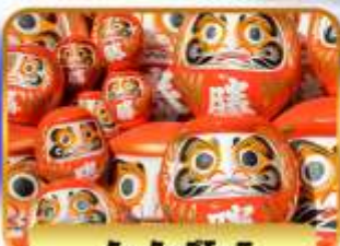
วัดคัตสึโงจิ