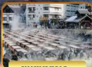
ชมยูบาทาเกะ