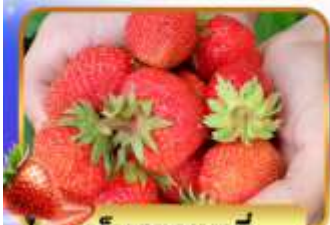
เก็บสตอเบอร์รี่