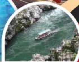
ล่องเรือใบแม่น้ำช่องเขาโอบิเคะ

Wifi on bus บริการน้ำดื่ม 10 คน ออกเดินทาง