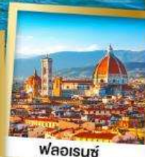
ฟลอเรนซ์