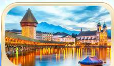
สะพานไมซ์ฮาป