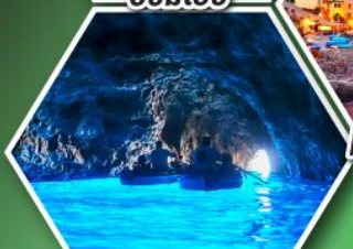
ถ้ำลูกรोटโต้