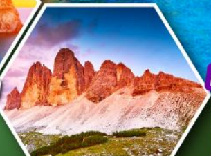
โตโลไมท์

โปรแกรมเดียว เก็บครบจบ อิตาลี ตั้งแต่เหนือถึงใต้