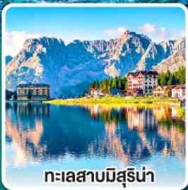
ทะเลสาบมิสุรีน่า