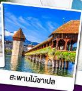
สะพานไม้ซาเปล