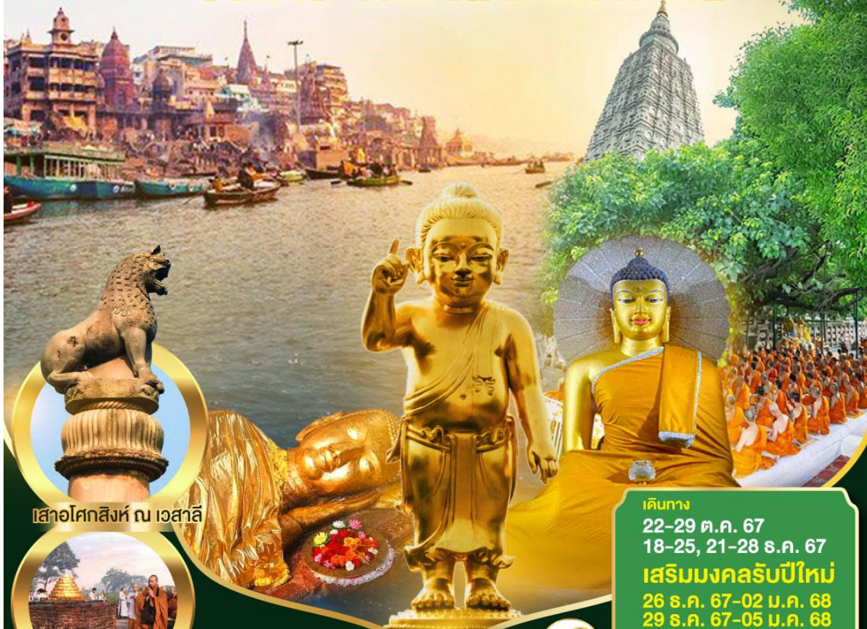
เสาอโศกสิงห์ ณ เวสาลี