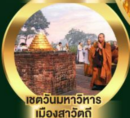
เขตวันมหาวิหาร เมืองสาวัตถี