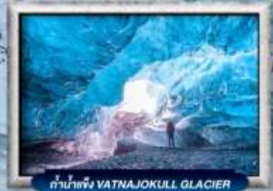
ถ้ำน้ำแข็ง VATNAJOKULL GLACIER

บินทรู สายการบิน Full Service | พิเศษ! ทานอาหารโคมทระจกวิจ 360 องศา