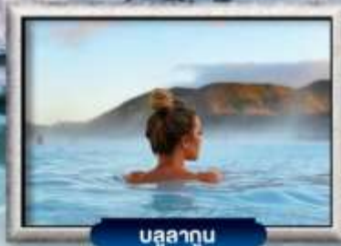
บูลลาทูน