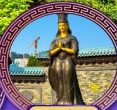
วัดเจ้าแม่กั๊กทิม