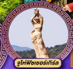
จูโห่พิงเซอร์กิส