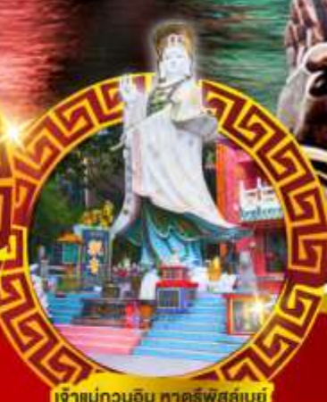
เจ้าแม่กวนอิม ทาคีร์ฟัสส์เบย์

เมนูสุด พิเศษ!! ต้มช้ำฮ่องกง บุฟเฟ่ต์ชาบูสโตร์ฮ่องกง, ห่านย่าง