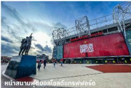
หน้าสนามฟุตบอลโอลด์แทรฟฟอร์ด