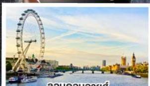
ลอนดอนอายส์