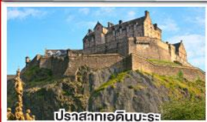
ปราสาทอดินเบระ