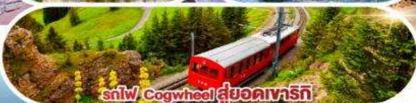
รถไฟ Cogwheel สู้ออดเวจาร์ก