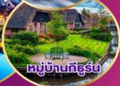
หมู่บ้านทีธูร์น