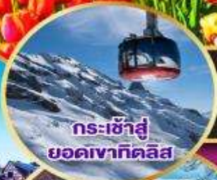
กระเช้าสู่ยอดเขากิลคิส

19-28 มี.ค.68 / 01-10, 12-21, 14-23 เม.ย.68 03-12, 04-13, 05-14 พ.ค.68