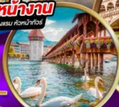
สะพานไม้ ซาเปลา