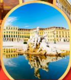
พระราชวังซินบรูนน์