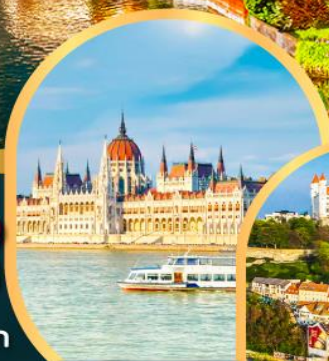
ส่องเรือแม่น้ำดานูบ