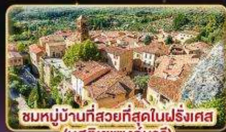
ชมหมู่บ้านที่สวยงามที่สุดในฝรั่งเศส (มูสติเยแซงท์มารี)