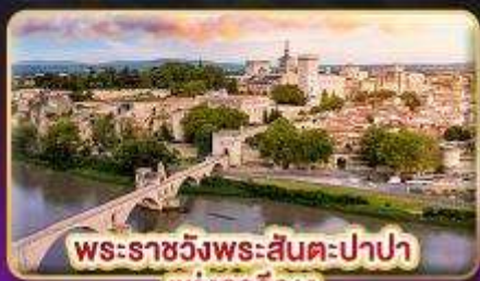
พระราชวังพระสันตะปาปา แห่งอเวัญ