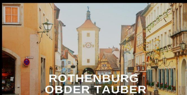
ROTHENBURG OB DER TAUBER