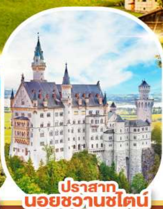
ปราสาท นอยชวานชไตน์