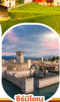
ซิร์มีโอเน

เดินทาง 04-10 มี.ค. 68 28 เม.ย. - 04 พ.ค. 68 30 พ.ค. - 05 มิ.ย. 68 11-17 มิ.ย. 68