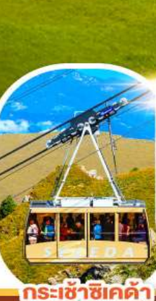
กระเช้าเซเคด้า