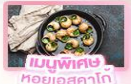
เมนูพิเศษ หอยออสตาโก้

เยอรมัน เนเธอร์แลนด์ เบลเยียม ฝรั่งเศส Keukenhof